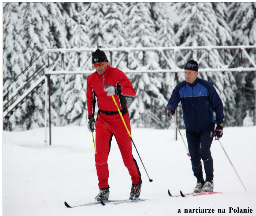
a narciarze na Polanie

gach w rowach leżały samochody, a w zakładach wulkanizacyjnych były długie kolejki. Niewielu kierowców zmieniło opony na zimowe. Efekty były widoczne np. na tradycyjnie zablokowanej drodze krajowej. Samochody ciężarowe stały, utrudniając ruch, już przed Szklarską Porębą. Ulica Sikorskiego była zablokowana na prawym pasie niemal na całej długości do centrum miasta do mostu nad Kamienną. c.d.str.2