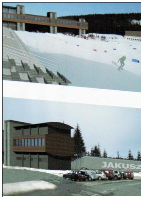
koncepcja budowy „stadionu zimowego”

Niewykorzystanie przez Bieg Piastów dotacji na szczęście nie ma związku z zawodami Pucharu Świata w narciarstwie klasycznym, o które stara się Miasto. Jak zapewnią władze stowarzyszenia, aby przeprowadzić zawody, wystarczą specjalne kontenery na zaplecze socjalne dla zawodników, które są w planach zakupów. Do tematu wkrótce powrócimy. (red)