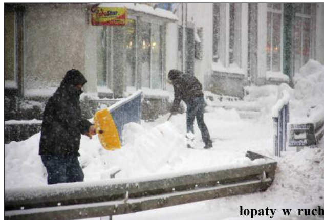
łopaty w ruch

MZGL. Wydatki na odbudowanie zaplecza technicznego w ostatnich 2 latach przekroczyły milion złotych. W efekcie zakład dzisiaj dysponuje sprzętem, który pozwala na samodzielne odśnieżanie najważniejszych ulic należących do miasta. Na