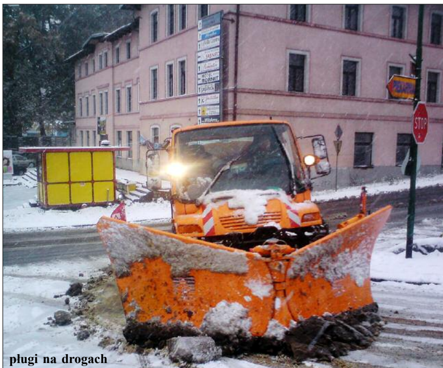
plugi na drogach

Atak zimy w połowie października zaskoczył też kierowców. Najlepiej to było widać 14 października, gdy na dro-