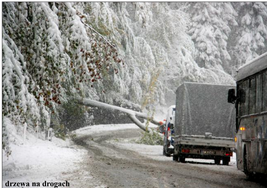
drzewa na drogach