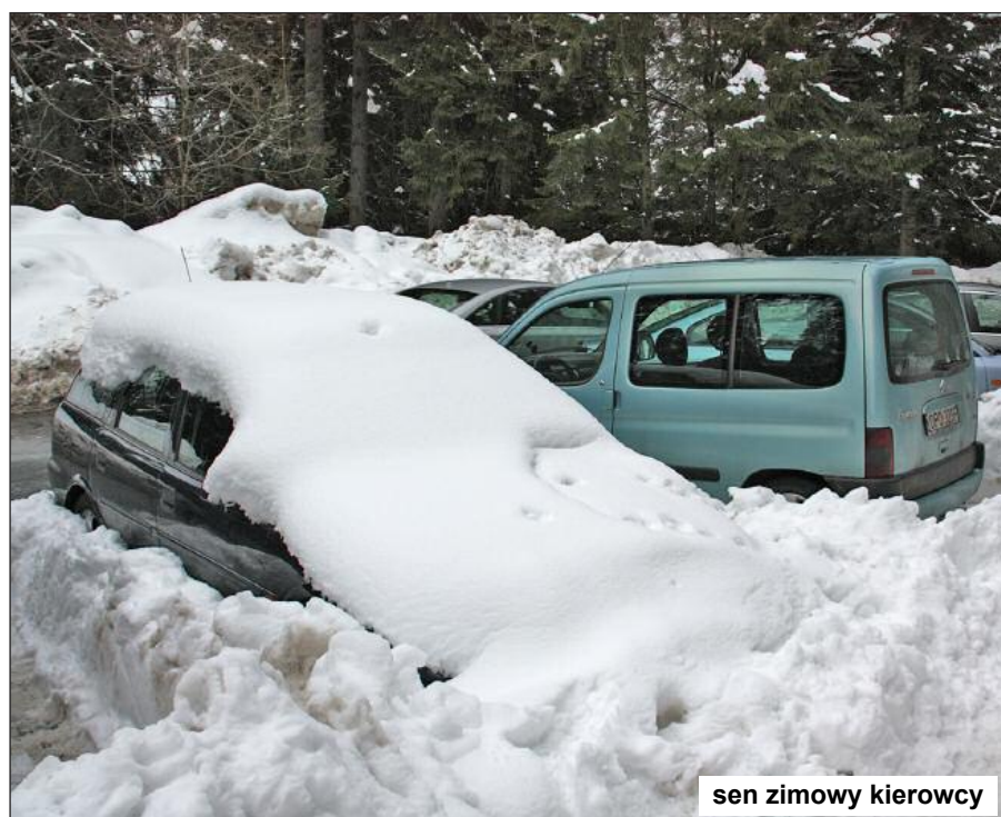
sen zimowy kierowcy