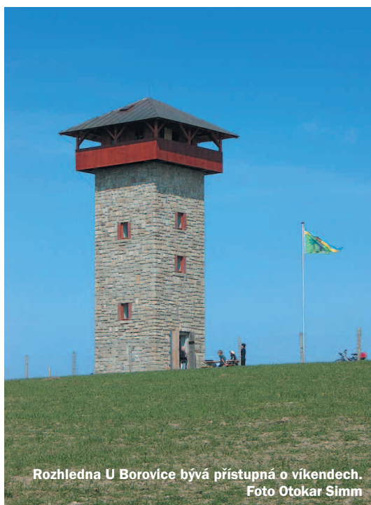
Rozhledna U Borovice bývá přístupná o víkendech.

Od rozhledny vyrazíme do Škodějova. Za osadou Zimrov se nachází autobusová zastávka Na Špekulaci (4 km), kde vlevo pod silnicí stojí kamenný pomník s reliéfem Dr. Karla Farského. Muž, po němž je pojmenován jablonecký kostel